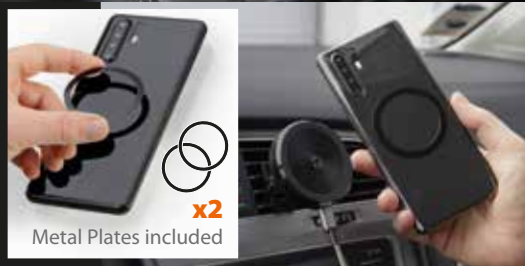
x2 Metal Plates included

CE IT Questo prodotto è contrassegnato dal marchio CE in conformità con le disposizioni della Direttiva 2014/53/UE e della direttiva RoHS 2011/65/UE. Con ciò Lampa S.p.A dichiara che questo prodotto è conforme ai requisiti essenziali e ad altre rilevanti disposizioni previste dalla Direttiva 2014/53/UE e della Direttiva 2011/65/UE. È fatto divieto all'utente di eseguire variazioni o apportare modifiche di qualsiasi tipo al dispositivo. Variazioni o modifiche non espressamente approvate da Lampa S.p.A. annulleranno l'autorizzazione dell'utente all'utilizzo dell'apparecchiatura. Il testo completo della dichiarazione di conformità UE è disponibile al seguente sito web: www.optiline.it