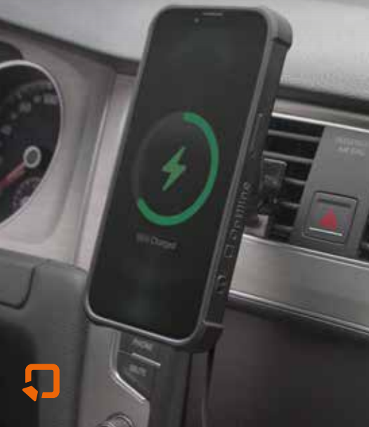
Mag Case Optiline