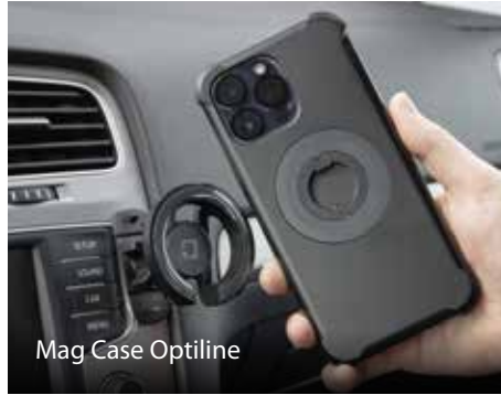
Mag Case Optiline