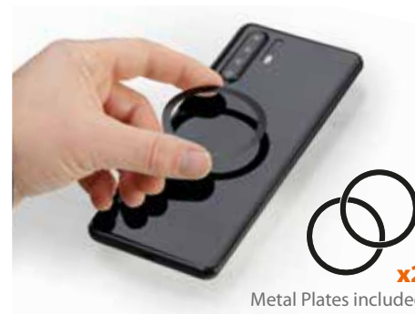
Metal Plates included x2