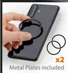
Metal Plates included x2

CE IT Questo prodotto è contrassegnato dal marchio CE in conformità con le disposizioni della Direttiva 2014/53/UE e della direttiva RoHS 2011/65/UE. Con ciò Lampa S.p.A dichiara che questo prodotto è conforme ai requisiti essenziali e ad altre rilevanti disposizioni previste dalla Direttiva 2014/53/UE e della Direttiva 2011/65/UE. È fatto divieto all'utente di eseguire variazioni o apportare modifiche di qualsiasi tipo al dispositivo. Variazioni o modifiche non espressamente approvate da Lampa S.p.A. annulleranno l'autorizzazione dell'utente all'utilizzo dell'apparecchiatura. Il testo completo della dichiarazione di conformità UE è disponibile al seguente sito web: www.optiline.it