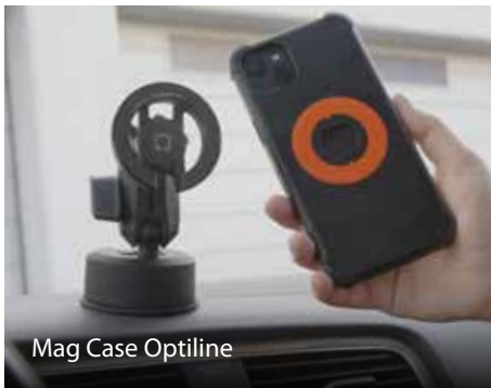
Mag Case Optiline