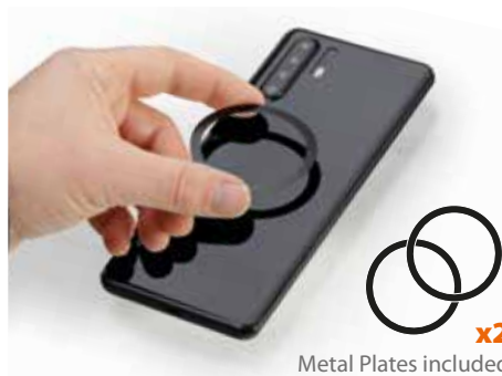
Metal Plates included x2