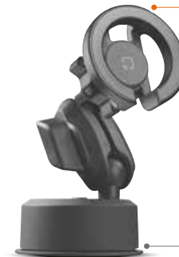
Ventosa adesiva Sticky suction cup

*MagSafe è un marchio registrato di Apple. *MagSafe is registered trademark of Apple.